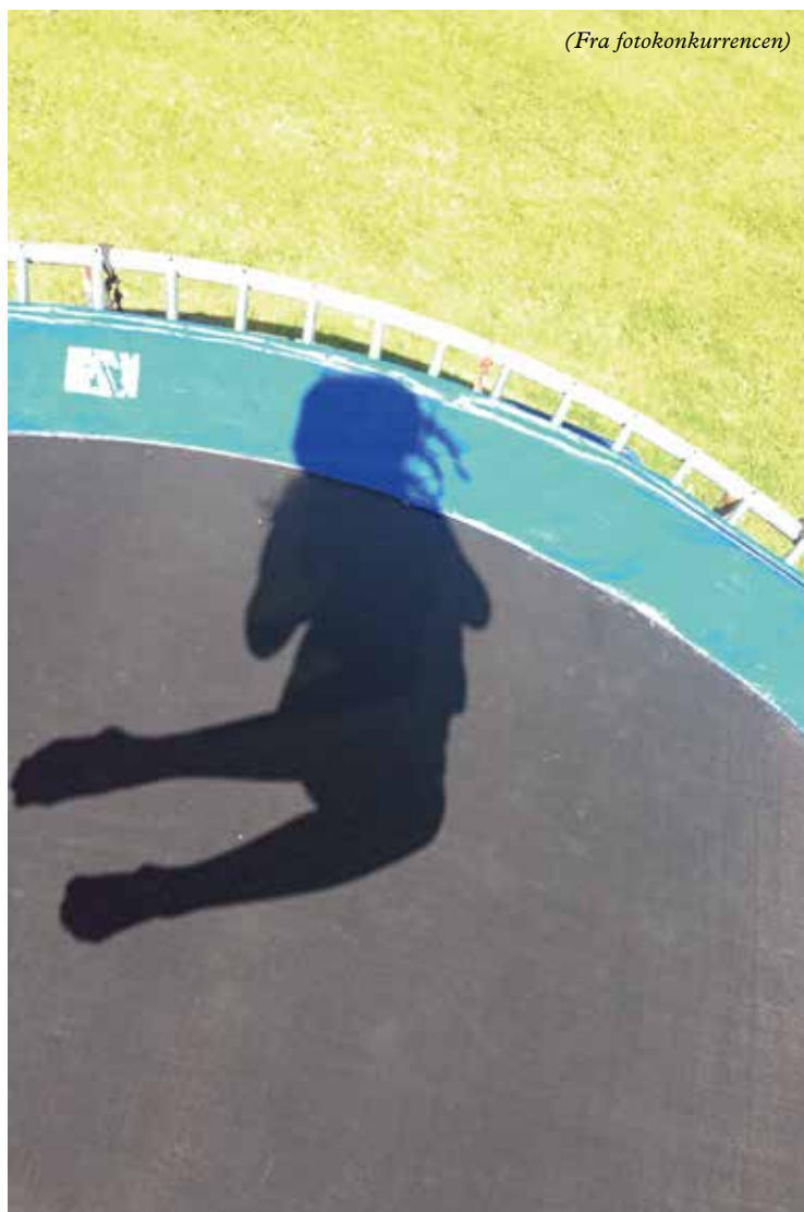
En af englens julenat på Hyrdernes mark?

Og Ordet blev kød og tog bolig iblandt os, og vi så hans herlighed, en herlighed, som den Enbårne har den fra Faderen, fuld af nåde og sandhed.“