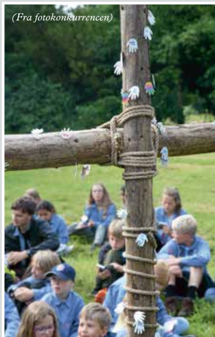
Vi er i Guds hænder