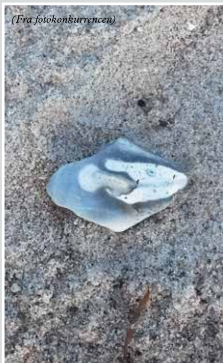
(Fra foto konkurrencen)

En kvinde bliver grebet i hør og en flok mænd vil stene hende. Jesus siger: „Den af jer, der er uden synd, skal kaste den første sten på hende”. Da mændene hørte det, slap de deres sten. Johannesevangeliet kap. 8