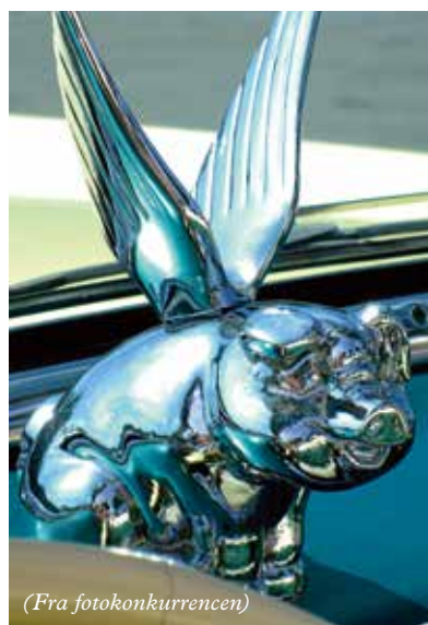
Har dyr et evigt liv?

Kom udklædt eller ej. Kom barn, kom voksen. Traditionen tro fejrer vi fastelavn med en kort og børnevenlig gudstjeneste i kirken. Efter gudstjenesten fortsætter vi dagen i Hvalsø Hallen med tøndeslagning, og hvad der dertil hører. Et arrangement i fællesskab med Socialdemokraterne.